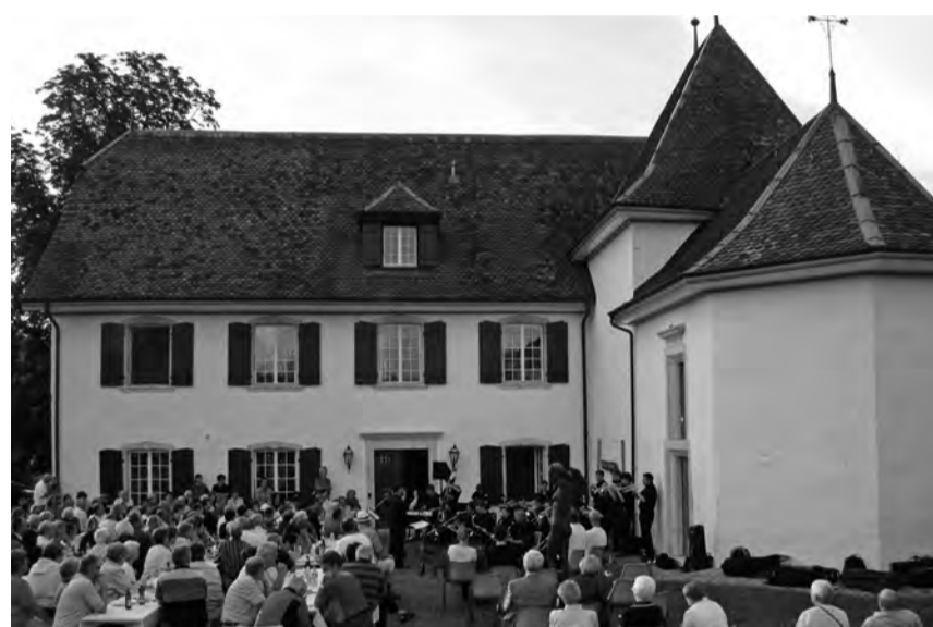
Konzert der Summer-Big-Band im Garten