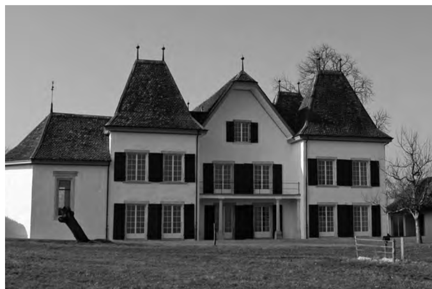
Schloesschen Vorder-Bleichenberg Biberist