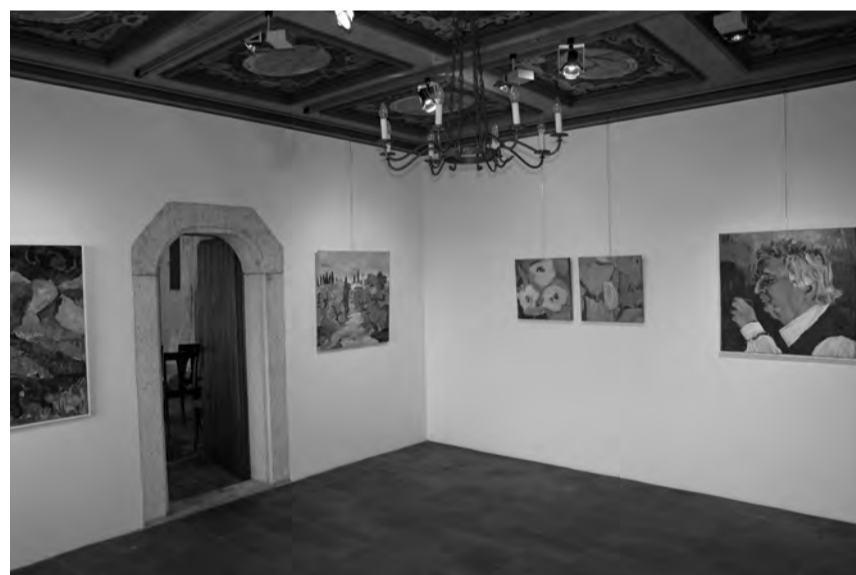
Helle, gepflegte Ausstellungsräume bieten viel Ambiente