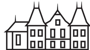
SCHLÖSSCHEN VORDER-BLEICHENBERG BIBERIST